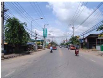
1.ภาพถ่ายสถานที่ใกล้เคียงด้านขวาของสถานที่ตั้ง