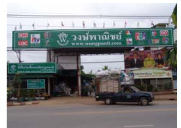
4.ภาพถ่ายของสถานที่ตั้ง