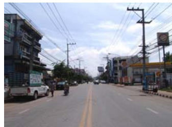
2.ภาพถ่ายสถานที่ใกล้เคียงด้านซ้ายของสถานที่ตั้ง