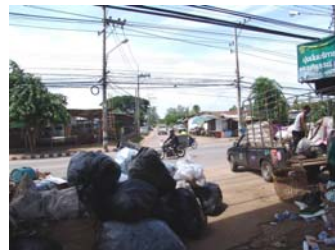
3.ภาพถ่ายฝั่งตรงข้ามของสถานที่ตั้ง