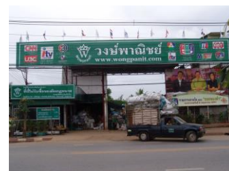
4.ภาพถ่ายของสถานที่ตั้ง