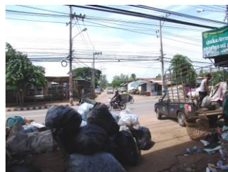
3.ภาพถ่ายฝั่งตรงข้ามของสถานที่ตั้ง