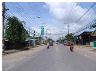
1.ภาพถ่ายสถานที่ใกล้เคียงด้านขวาของสถานที่ตั้ง